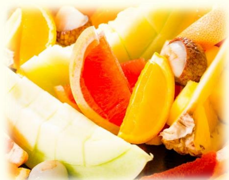
フルーツ盛り合わせ 1盛 10,000円 15~20名様分