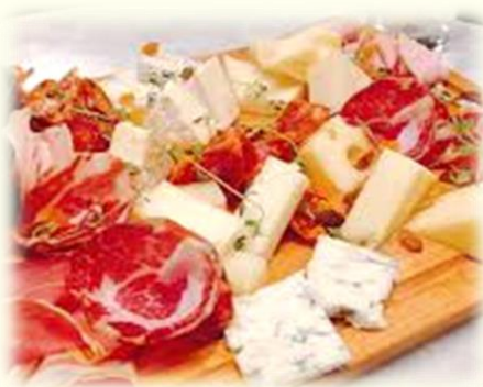
チーズ & 生ハム盛り合わせ 1盛 10,000円 15~20名様分