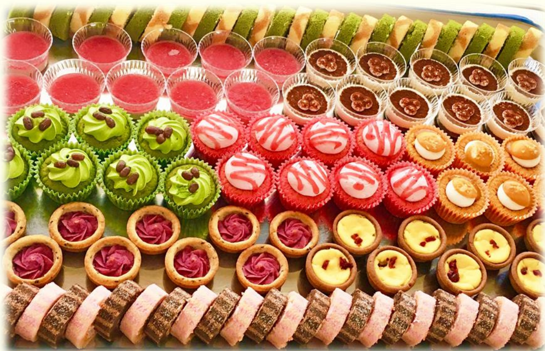
デザートビュッフェ 1名様1,200円